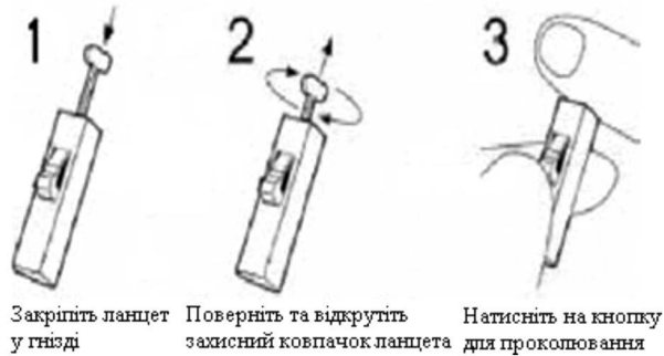
1 Закріпіть ланцет у гнізді 2 Поверніть та відкрутіть захисний ковпачок ланцета 3 Натисніть на кнопку для проколювання

Не відкривайте пакет поки ви не готові проводити тестування.