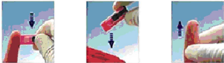
Щільно притисніть ланцет до вибраного місця та натисніть кнопку Утипізуйте ланцет у відповідному контейнері Стискайте палець до появи краплі крові